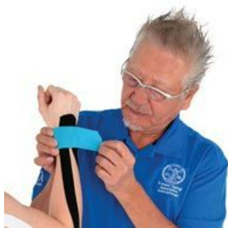
Кензо Касе (США)

Председатель Симпозиума по кинезиотейпированию. Президент Международной Ассоциации кинезиотейпирования и Национального колледжа хиропрактики в Японии, изобретатель методики кинезиотейпирования.