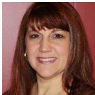
Грейсэnn Форрестер (США)

Председатель Симпозиума по кинезиотейпированию. Президент Международной Ассоциации кинезиотейпирования и Национального колледжа хиропрактики в Японии, изобретатель методики кинезиотейпирования.